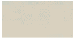
METAL FINISH Varnished Grey

Printed colors are to be considered as purely indicative.