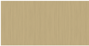
METAL FINISH Matt Gold

I colori stampati sono da considerarsi puramente indicativi.