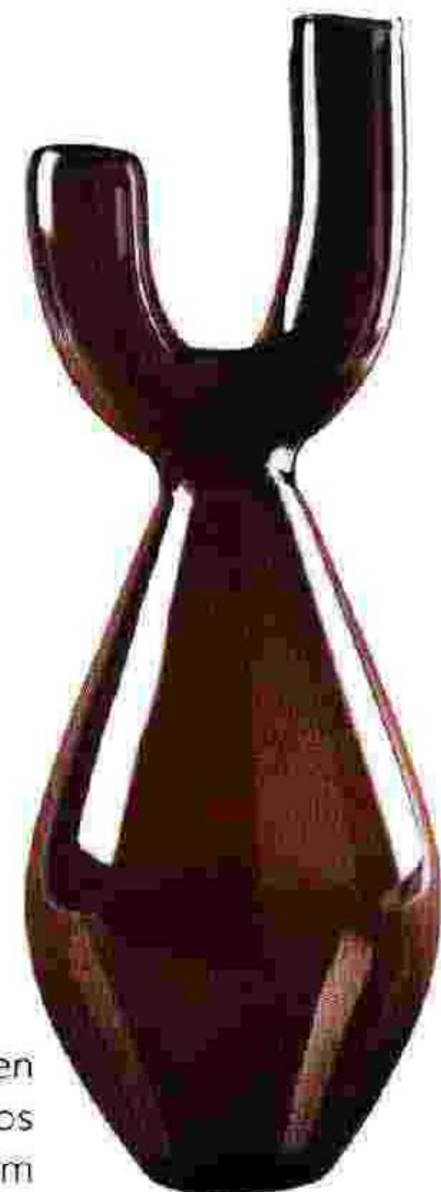
Vase des spanischen Labels www.losobjetosdecorativos.com