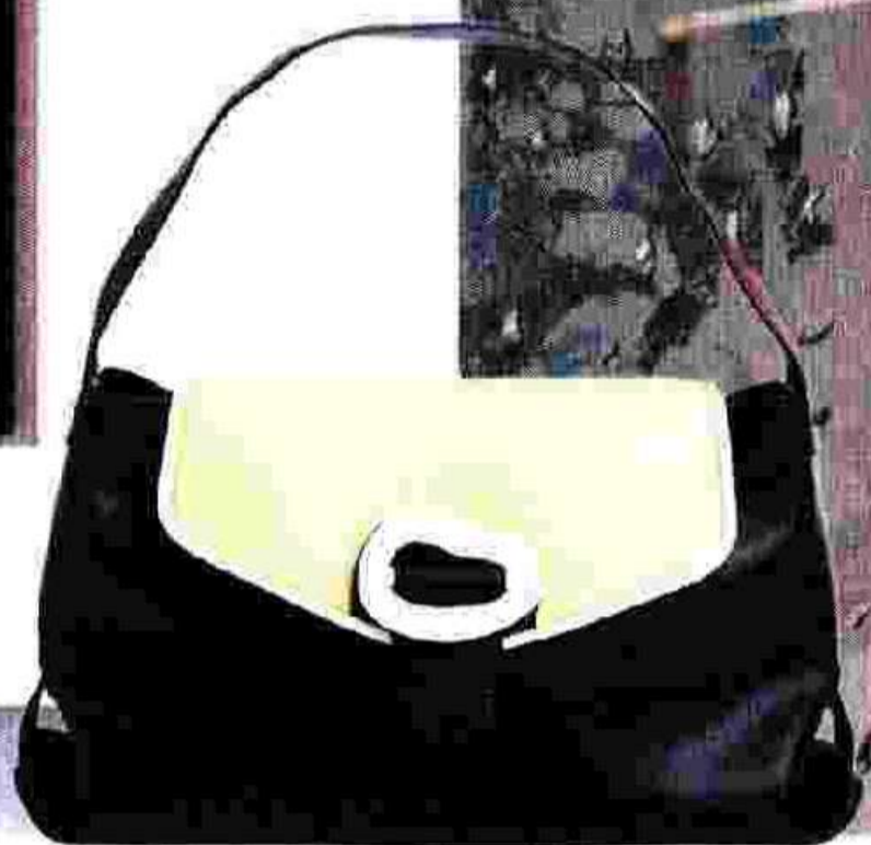
Vegane Handtasche „Billow Tile“ ( www.hvisk.com )

Kooperation zwischen der Kunstplattform www.junique.de und der Keramikschmiede Motel a Miilo