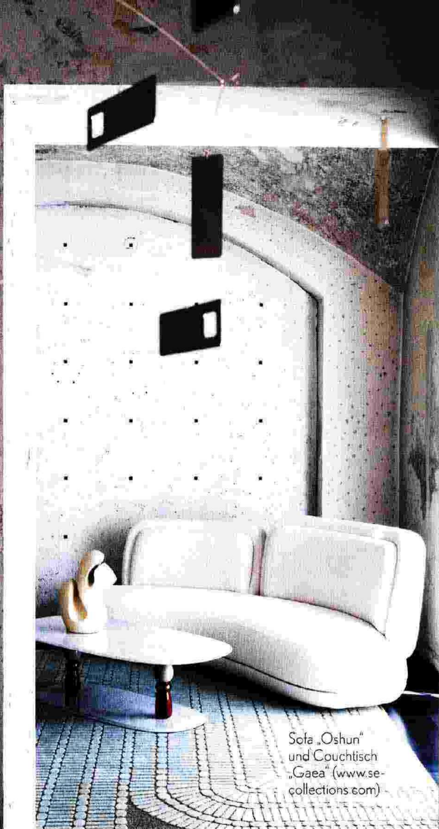
Sofa „Oshun“ und Couchtisch „Gaea“ ( www.secollections.com )

Farben: Sind hier nicht eindeutig definiert. Man wähle, was gefällt , je nachdem welche Inspirationsquelle die eigene Gefühlswelt besser ausdrückt. Formen: Drehen wir's einfach mal um – function follows form . Vielleicht nicht im Memphis-Sinne bis hin zur Unbenutzbarkeit, aber die Form ist das prägende Element.