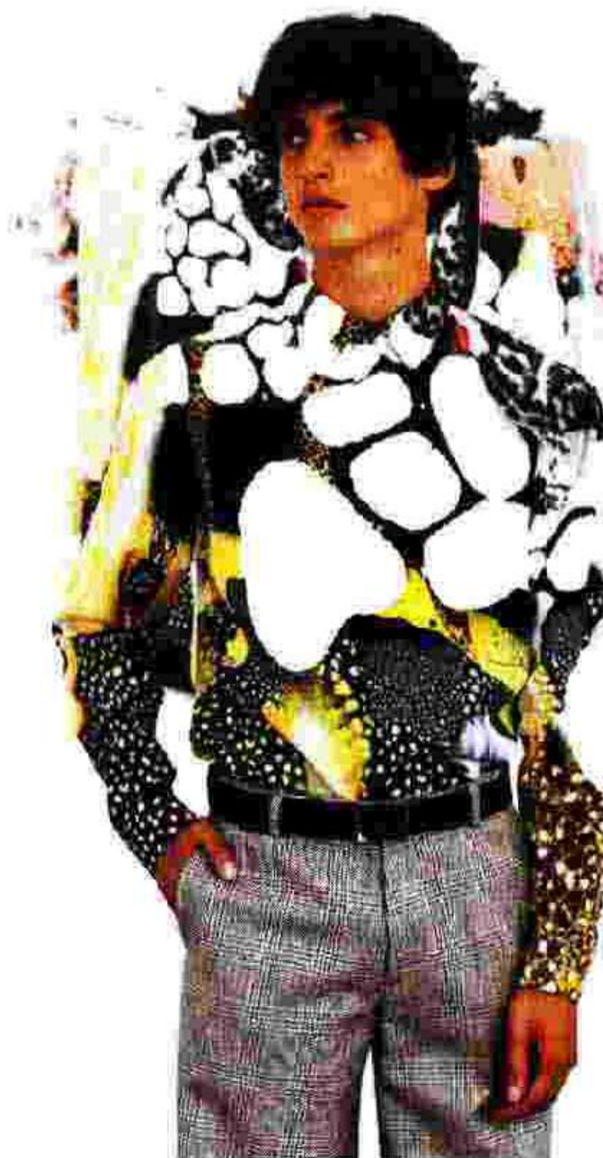
Keramikkünstler Brian Rochefort wurde für diese Kollektion zum Modedesigner ( www.berluti.com )