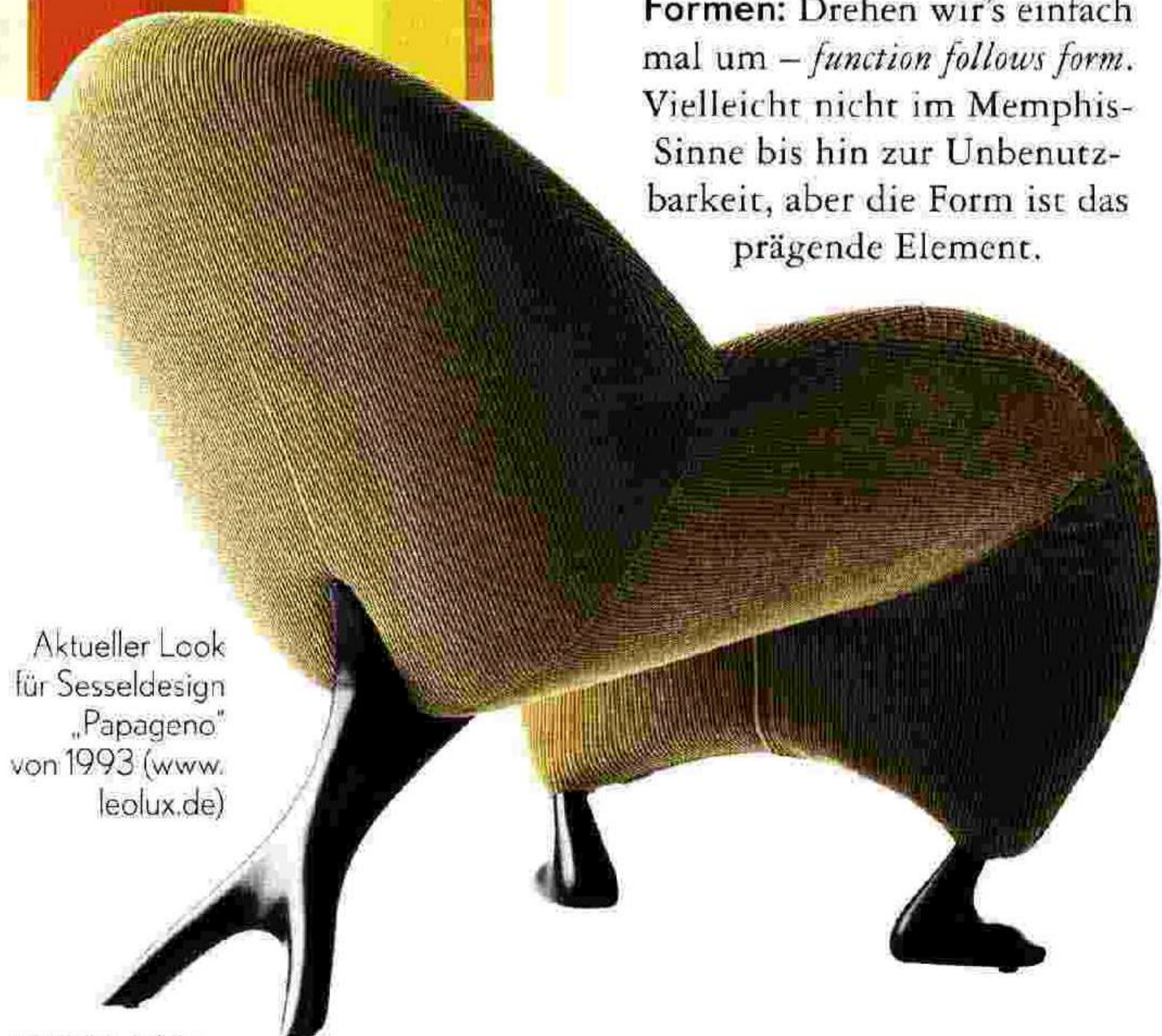
Aktueller Look für Sesseldesign „Papageno“ von 1993 ( www.leolux.de )