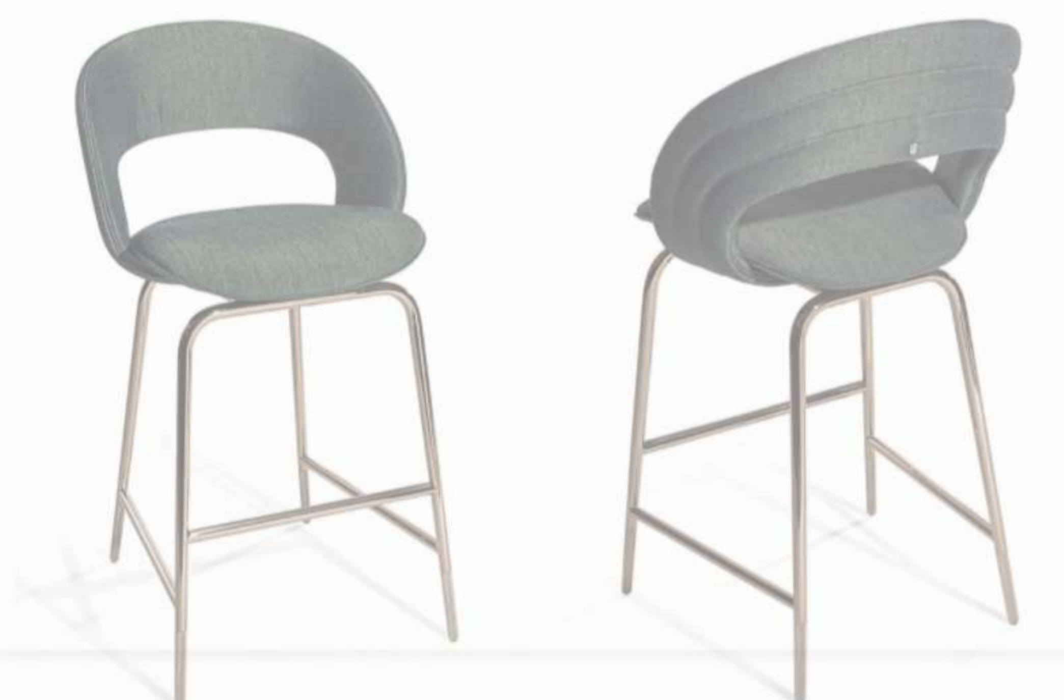
Kylo by Visionnaire, Design Alessandro La Spada

Lusso e sostenibilità possono incontrarsi? Ebbene sì. I brand luxury stanno muovendo i primi passi verso una via sostenibile e a basso impatto ambientale, per produrre capolavori unici nel rispetto delle risorse e della natura. Tra le aziende che hanno dichiarato a gran voce il loro impegno c'è Visionnaire , che ha fatto della sostenibilità la sua mission segnando così una nuova decade di necessaria presa di coscienza ambientale e sociale: il brand, che si pone oggi come manifesto Meta-Luxury, mette a punto nuove pratiche per l'uso responsabile dei materiali, uno sforzo che si traduce in ricerca tecnologica e in investimenti di efficientamento della catena produttiva e della qualità della vita dei propri artigiani.