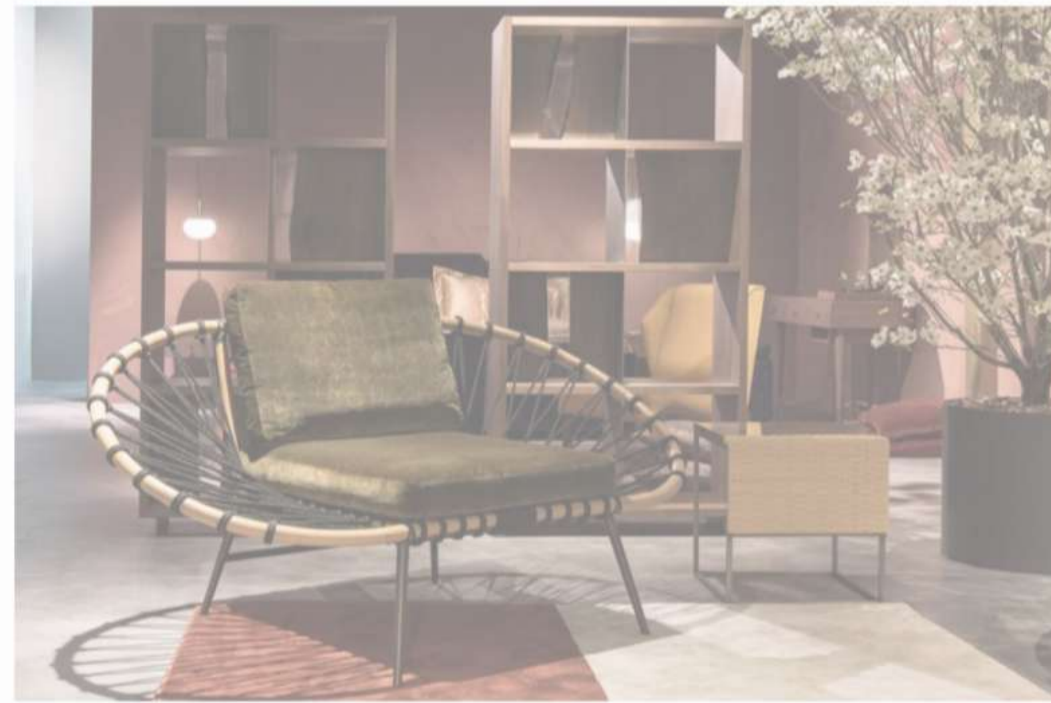
Discovery by Zanaboni Edizioni, Design Studio Mamo

Nel campo dell'illuminazione, Preciosa , in Bohemia, nel Paese dei cristalli, ha adottato una politica dedicata all'environmental responsibility, garantendo condizioni di lavoro sicure durante l'intero processo di produzione e pratiche rispettose dell'ambiente, con la riduzione del consumo di acqua, la creazione di meno scarti, e il riuso, come accade nella collezione di vasi e oggetti ideati in collaborazione con il brand Prasklo , in cemento e vetro recuperato in azienda.