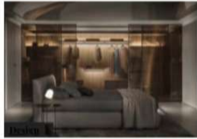
Effebiquattro Milano presenta Indoor