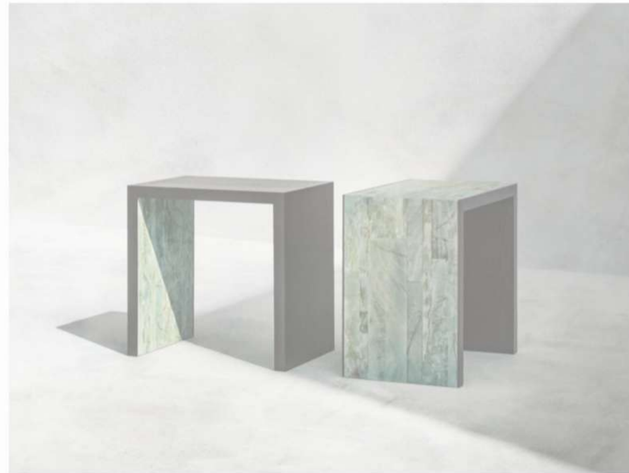
Puro by Armani/Casa

Un esempio è Iris , il tessuto per outdoor e indoor composto di fili di poliestere, ottenuti dal riuso di bottiglie di plastica disperse nell'ambiente, prodotto a basse emissioni di Co2 e minor spreco d'acqua, per un risparmio energetico di oltre il 60 per cento rispetto ai normali processi produttivi.