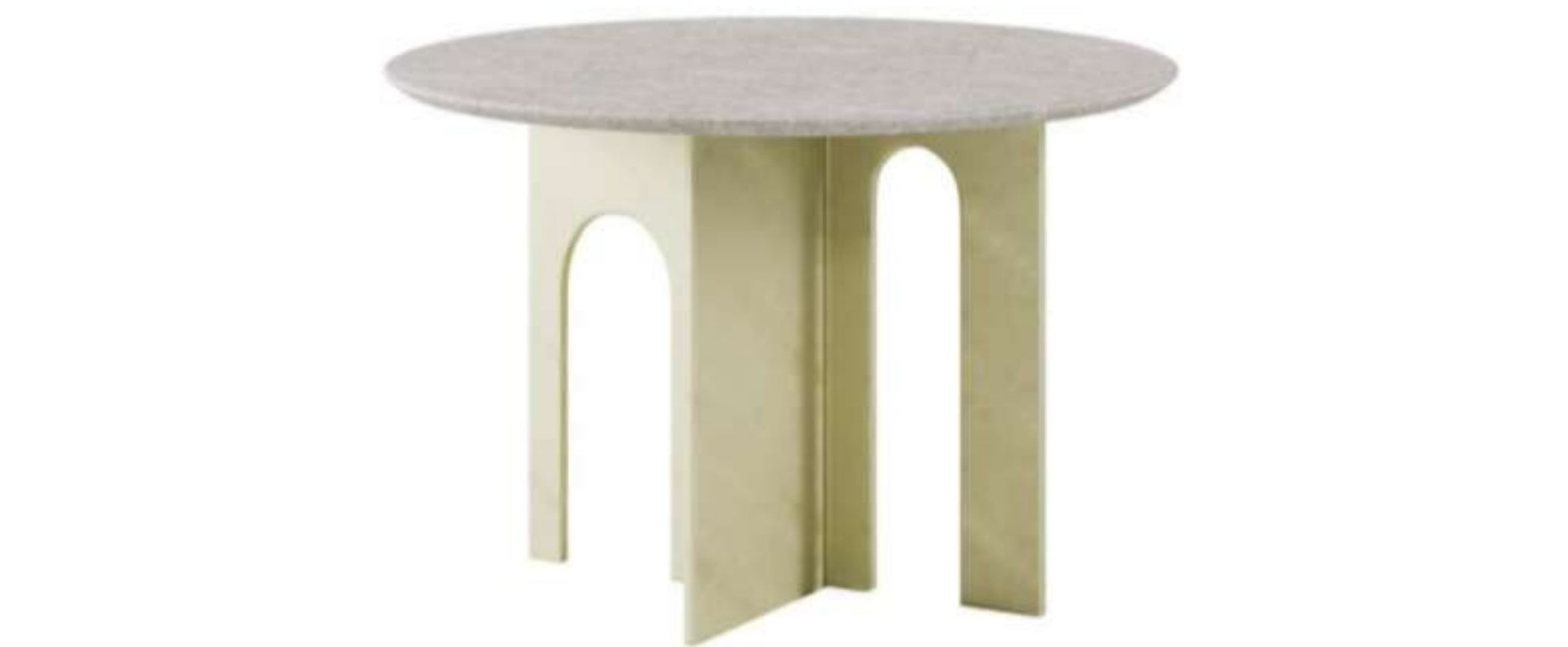
Arche by Paolo Castelli

Un'altra realtà che abbraccia la filosofia dell'economia circolare è Armani/Casa , che per i tavolini Puro sceglie frassino e quarzite smeraldo ottenuti recuperando i pannelli di legno e pietra utilizzati per la creazione di altri mobili in collezione, mentre per gli accessori per la casa, come nella tovaglietta Premier , impiega il tessuto di camiceria riciclato.