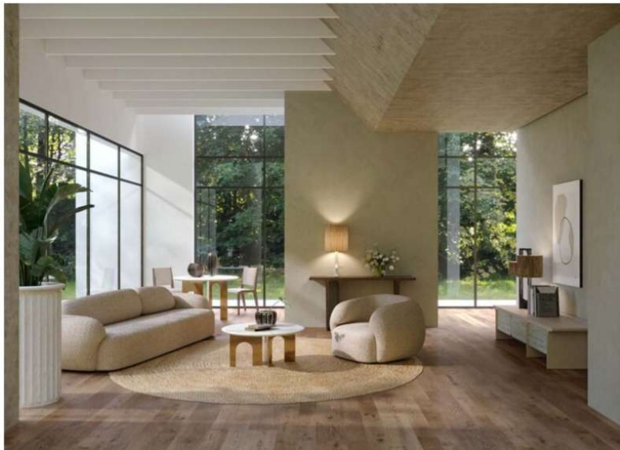
Greenkiss collection by Paolo Castelli

Lusso e sostenibilità possono incontrarsi? Ebbene sì. I brand luxury stanno muovendo i primi passi verso una via sostenibile e a basso impatto ambientale, per produrre capolavori unici nel rispetto delle risorse e della natura. Tra le aziende che hanno dichiarato a gran voce il loro impegno c'è Visionnaire , che ha fatto della sostenibilità la sua mission segnando così una nuova decade di necessaria presa di coscienza ambientale e sociale: il brand, che si pone oggi come manifesto Meta-Luxury, mette a punto nuove pratiche per l'uso responsabile dei materiali, uno sforzo che si traduce in ricerca tecnologica e in investimenti di efficientamento della catena produttiva e della qualità della vita dei propri artigiani.