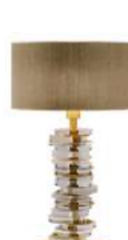
Abat Jour AMBRA by PAOLO CASTELLI