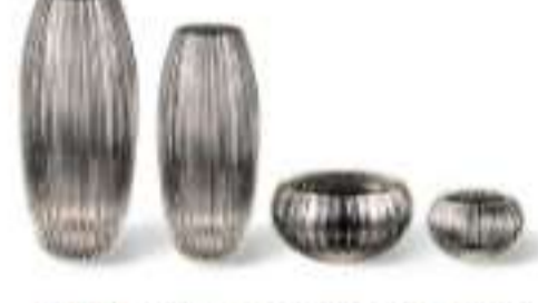
Vasi di Murano - COLLEZIONE COSTE by PAOLO CASTELLI