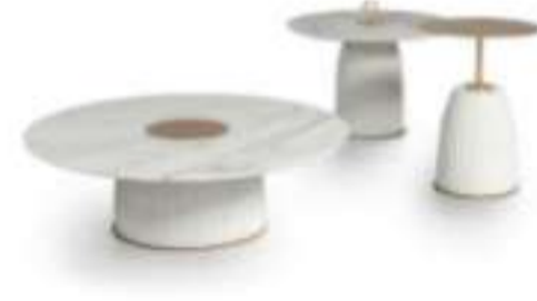
Tavolino da caffè DIONE by PAOLO CASTELLI