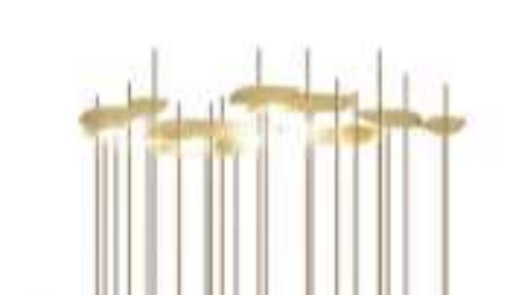
Lampada da Tavolo ANODINE by PAOLO CASTELLI