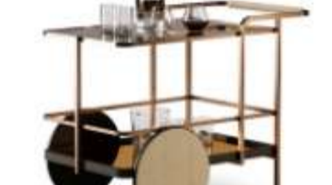
Carrello CONVIVIER by PAOLO CASTELLI