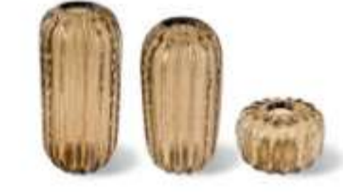
Vasi di Murano - COLLEZIONE BOLLE by PAOLO CASTELLI