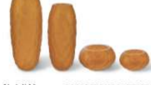
Vasi di Murano - COLLEZIONE BATTUTO by PAOLO CASTELLI