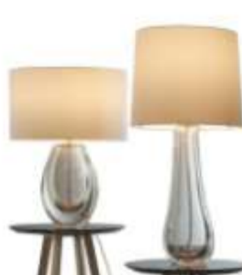
Abat Jour COLETTE e HUGO by PAOLO CASTELLI