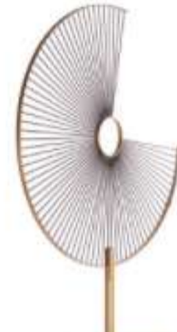
FLARE Separé Paravento by PAOLO CASTELLI