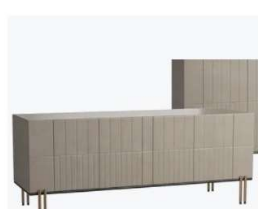
Paolo Castelli SOFT RATIO - Madia in MDF con illuminazione integrata