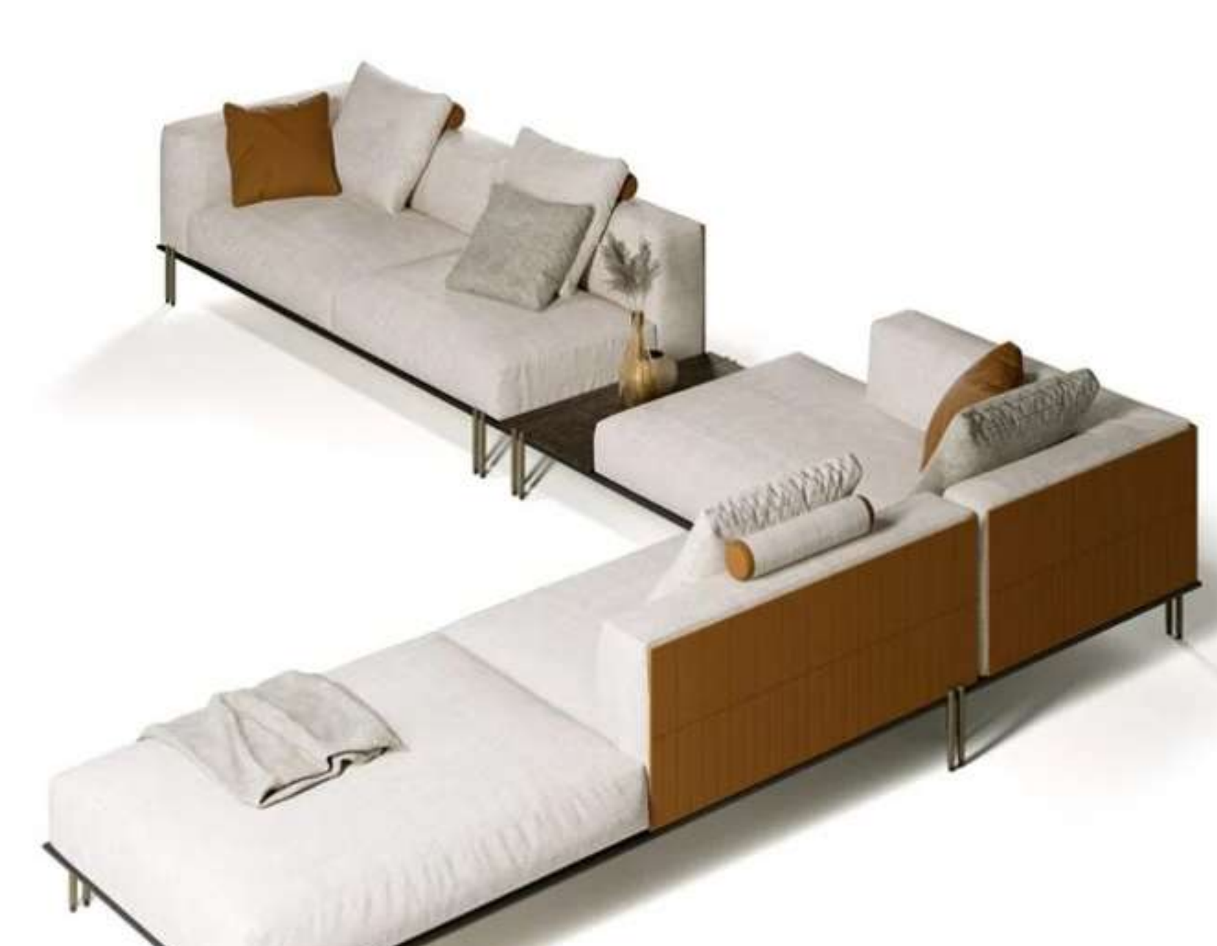
Paolo Castelli, Soft Ratio sofa