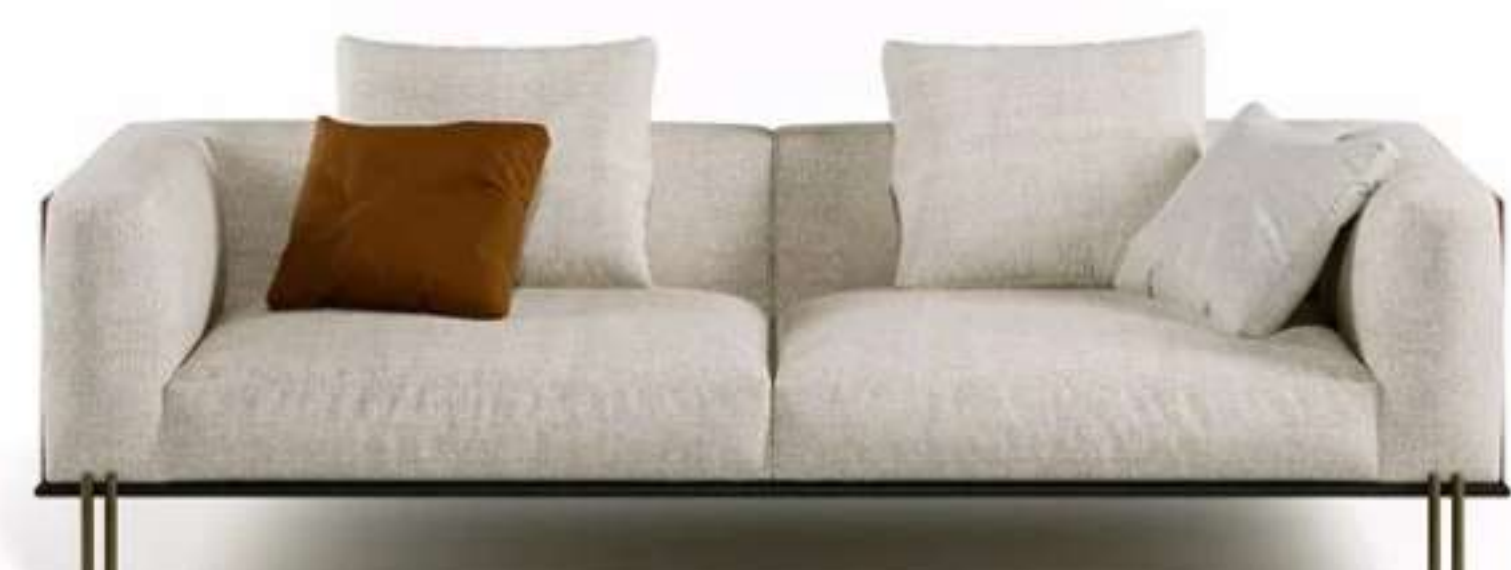
3. Paolo Castelli, Soft Ratio sofa

Lineari e leggeri, i due divani e gli elementi componibili hanno base e piedini in metallo, declinati in finitura nero opaco e bronzo ottone opaco. La scocca esterna in pelle è definita e valorizzata da cuciture in tinta e a contrasto, mentre la cuscinatura di sedile e schienale è in poliuretano espanso sagomato a quote differenziate. Un piano in pietra Pece o pelle completa infine il modulo chaise longue con tavolino integrato.