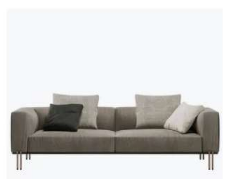
Paolo Castelli SOFT RATIO - Divano a 3 posti