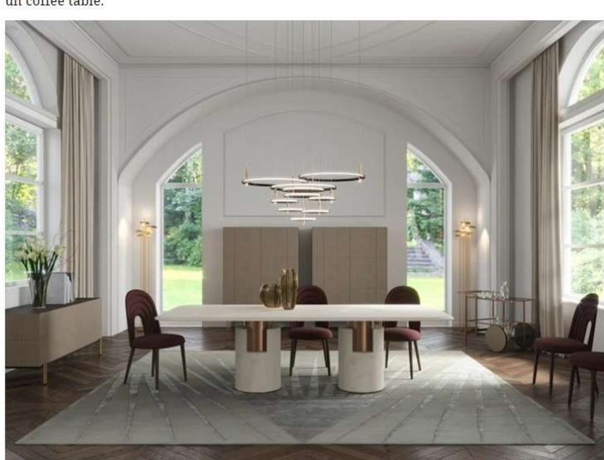
1. Paolo Castelli, Soft Ratio cabinets

La famiglia di imbottiti Soft Ratio si traduce in un sistema di sedute componibili a 11 elementi lineari, ad angolo o a penisola, che si abbinano tra loro per comporre molteplici configurazioni. Il risultato è un vero e proprio spazio abitativo destinato alla conversazione, alla lettura o al relax.