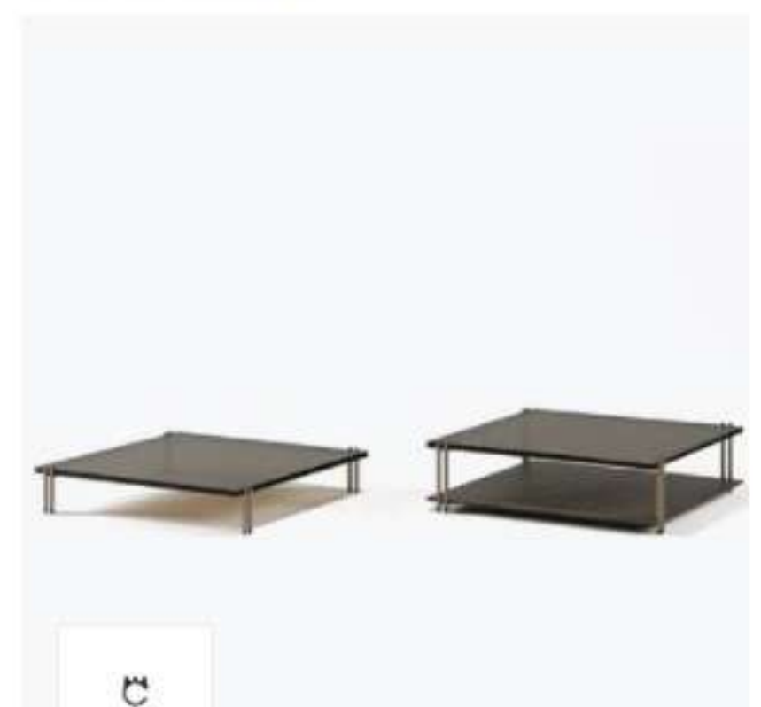
Paolo Castelli SOFT RATIO - Tavolino in pietra Pece e vetro con vano contenitore