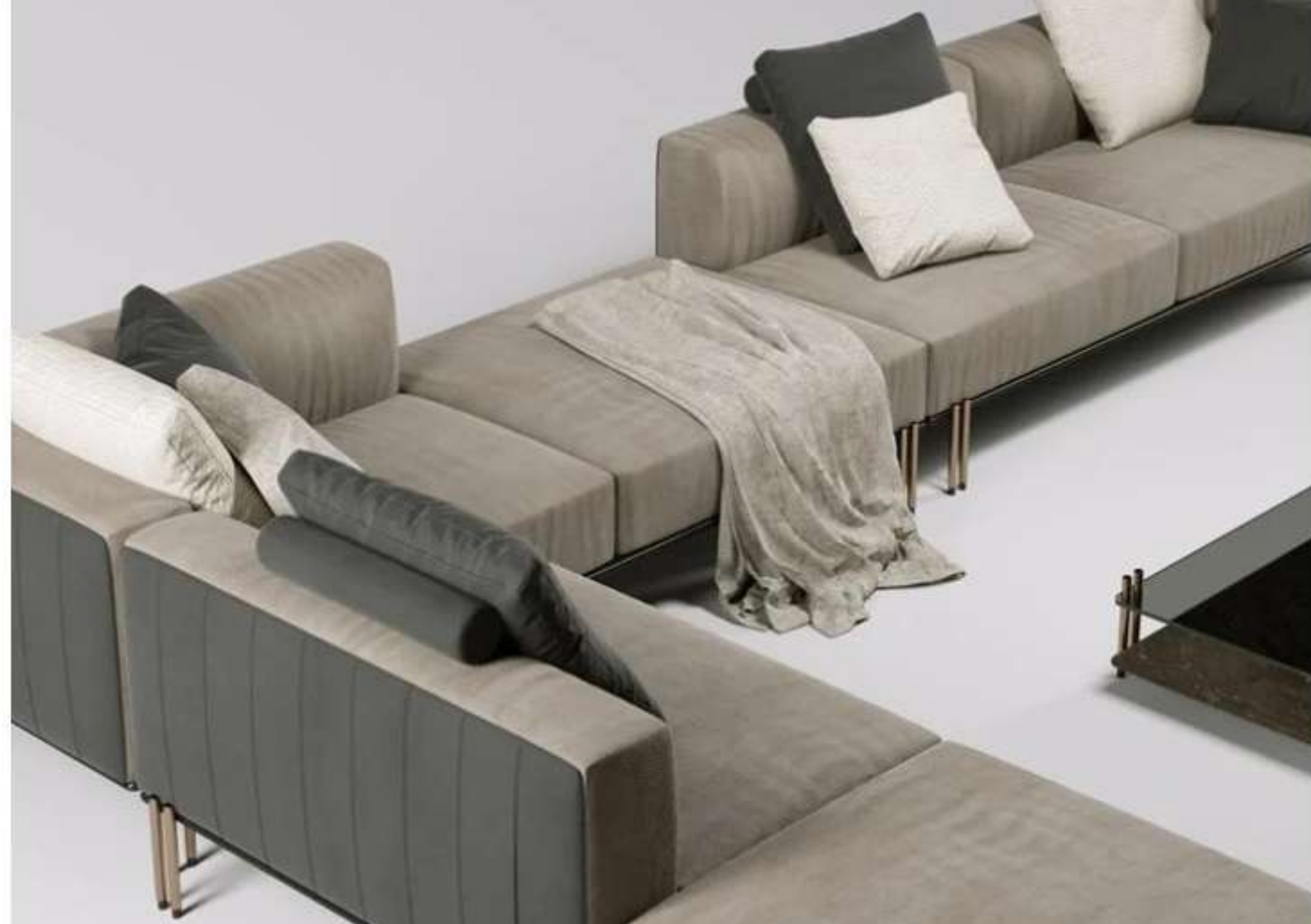
2. Paolo Castelli, Soft Ratio sofa

La famiglia di imbottiti Soft Ratio si traduce in un sistema di sedute componibili a 11 elementi lineari, ad angolo o a penisola, che si abbinano tra loro per comporre molteplici configurazioni. Il risultato è un vero e proprio spazio abitativo destinato alla conversazione, alla lettura o al relax.