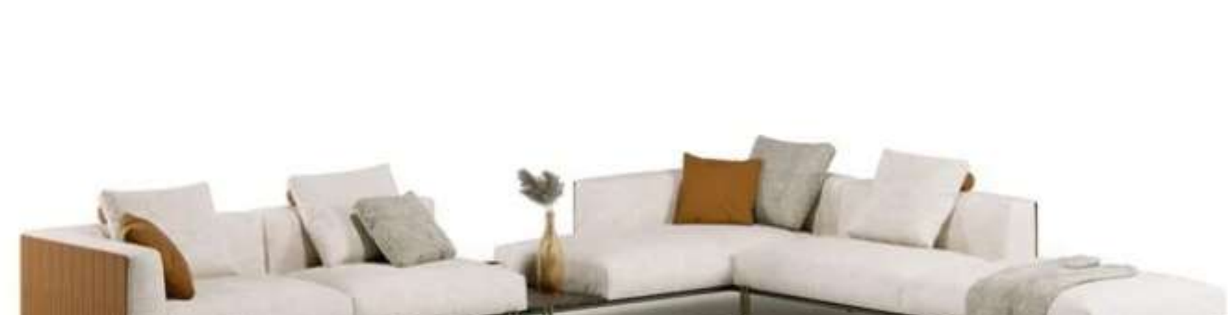
Paolo Castelli, Soft Ratio sofa