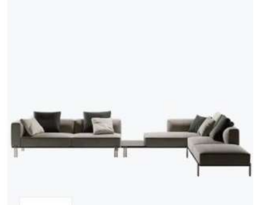
Paolo Castelli SOFT RATIO - Divano angolare componibile in pelle