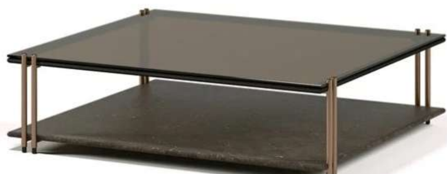
Paolo Castelli, Soft Ratio coffee tables

Puro ed essenziale, il tavolino Soft Ratio completa la proposta living. La base e i piedini in metallo si ripetono, mettendo in risalto la leggerezza complessiva del progetto. Il ripiano superiore è definito dal vetro trasparente color Avana, mentre quello inferiore si declina in pietra Pece o in pelle color testa di moro.