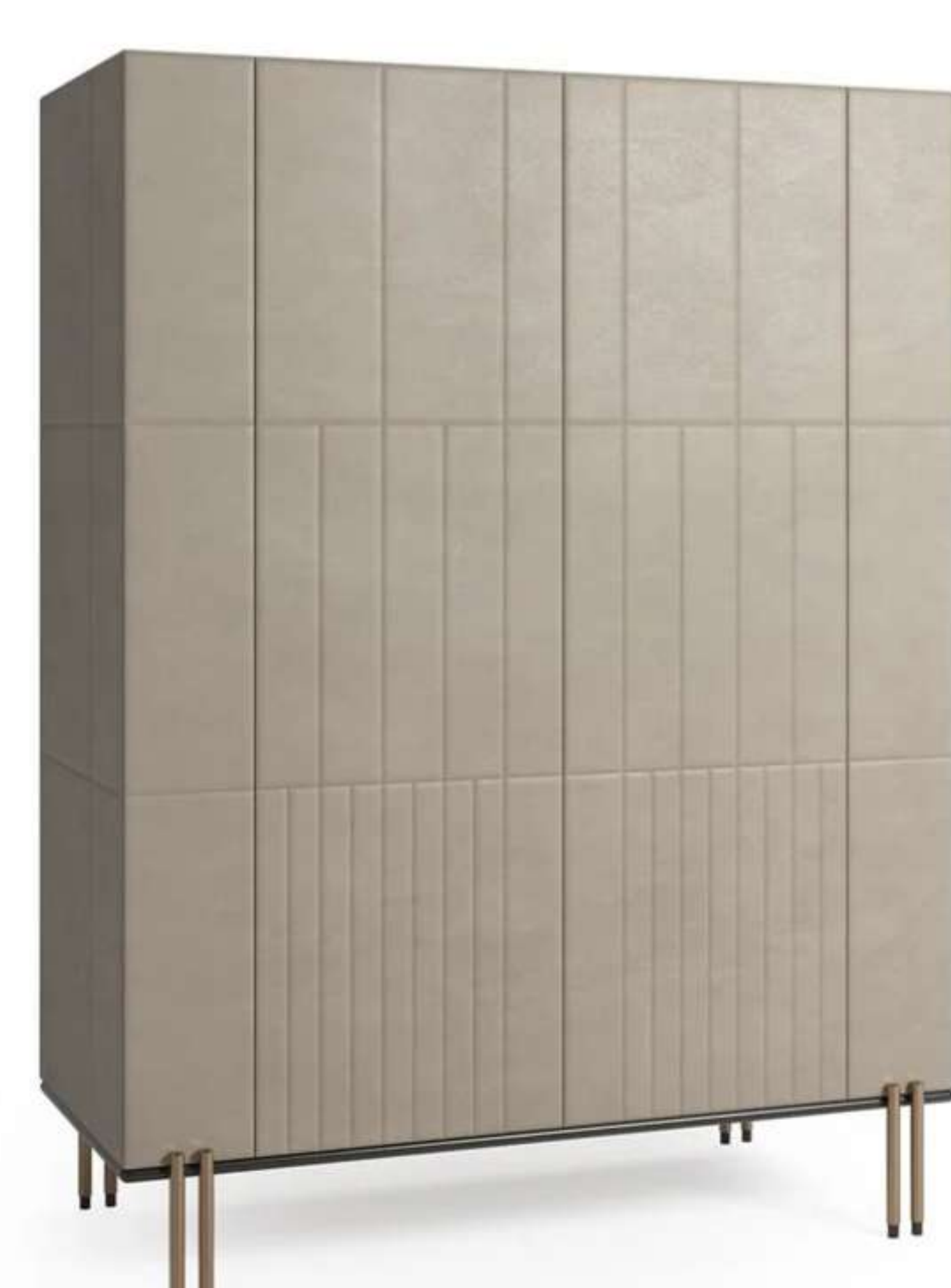
5. Paolo Castelli, Soft Ratio Cabinets

Il modello High Cabinet (L 122 x P x A 170 cm) è disponibile nella versione con 3 ripiani in vetro extrachiaro o nella versione con 2 cassetti imbottiti - rivestiti internamente in microfibra in tinta - e 1 ripiano in vetro extrachiaro, ed è dotato di illuminazione interna a LED e fondo in vetro specchiato bronzo.