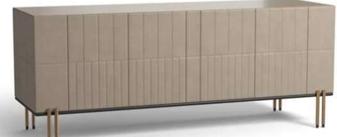
4. Paolo Castelli, Soft Ratio Cabinets

Il modello Low Cabinet (L 193 x P 59 x A 74 cm) è attrezzato con 1 ripiano in vetro extrachiaro. Il fondo è in vetro specchiato bronzo lucido e il top in vetro retrolaccato lucido in tinta. L'apertura touch delle ante include un funzionale sistema push-pull, che garantisce continuità geometrica.