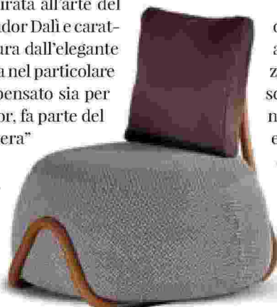
Poltroncina Babou by Paolo Castelli

Per concludere, un oggetto decisamente particolare: la Poltrona Green Rabbit design Pj Natuzzi, Negramaro e Fabio Novembre prodotta