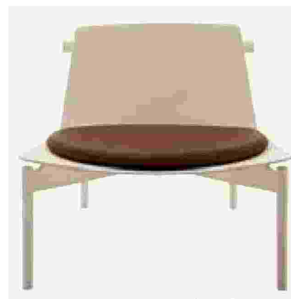
Poltroncina Eryt di Lissoni per B&B Italia

da Natuzzi. Ispirata a un verso della canzone "Mentre tutto scorre" dei Negramaro, nasce la poltrona Green Rabbit dalla seduta avvolgente rivestita da bouclé di lana con lunghe orecchie verdi. Il modello è pensato in un'edizione limitata di soli cento pezzi.