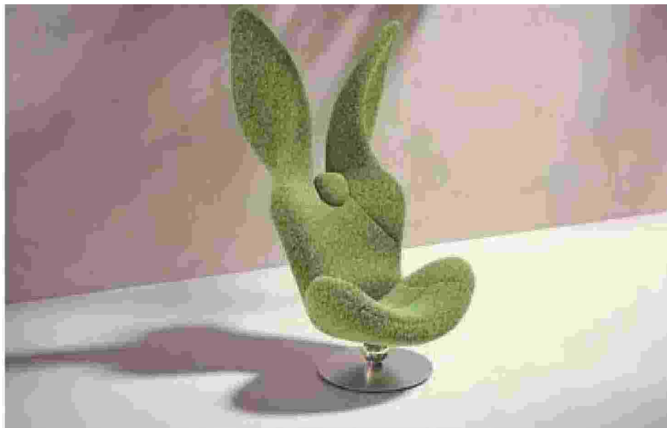
Poltrona Green Rabbit by Natuzzi