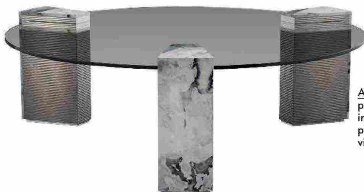
ADMETO di Marco Piva per Visionnaire. Basamenti in acciaio e marmo, piano in vetro fumé. visionnaire-home.it