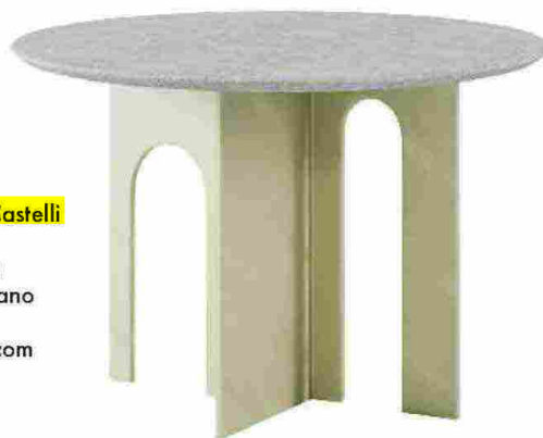
ARCHE di Hubert de Malherbe, Paolo Castelli e Thierry Lemaire per Greenkiss. Struttura in lamiera metallica e piano in pietra antica grigia o nera. paolocastelli.com