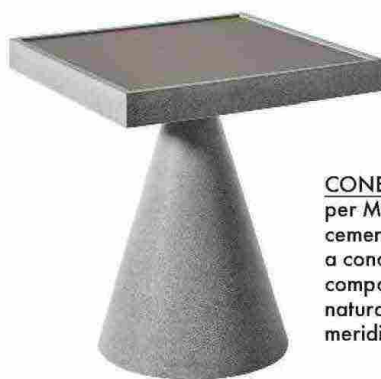
CONE di Andrea Parisio per Meridiani. In solido cemento Ductal® con base a cono, formato da finissimi componenti minerali naturali e fibre organiche. meridiani.it