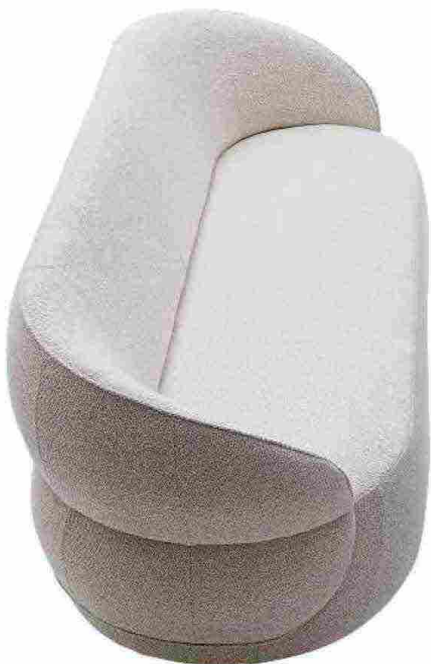
CLIP di Nika Zupanc per Ditre Italia. Invogliano al relax le linee curvy enfatizzate dall'effetto cintura che definisce l'imbottito. ditreitalia.com