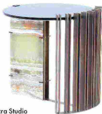
RIDEAU di Odra Studio per Dimoregallerie. In alabastro verde, ottone e vetro in grigio fumo. dimoregallerie.com

Pilastri, colonnati, portici e piramidi sono le strutture portanti dei nuovi tavolini