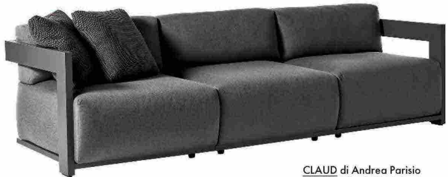
CLAUD di Andrea Parisio per Meridiani. Modulare, abbinabile a poltroncine e daybed, ha struttura in legno e cuscineria extra soft. meridiani.it