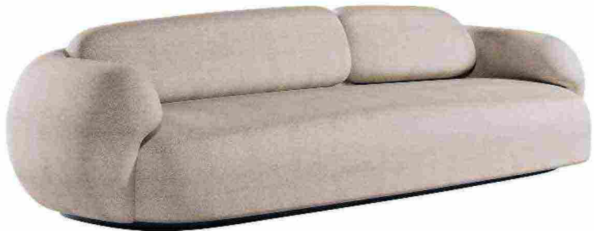
CORAL di Greenkiss per Paolo Castelli . Rivestito in lana bouclé, ha una struttura monolitica con imbottitura in gomma biologica. paolocastelli.com