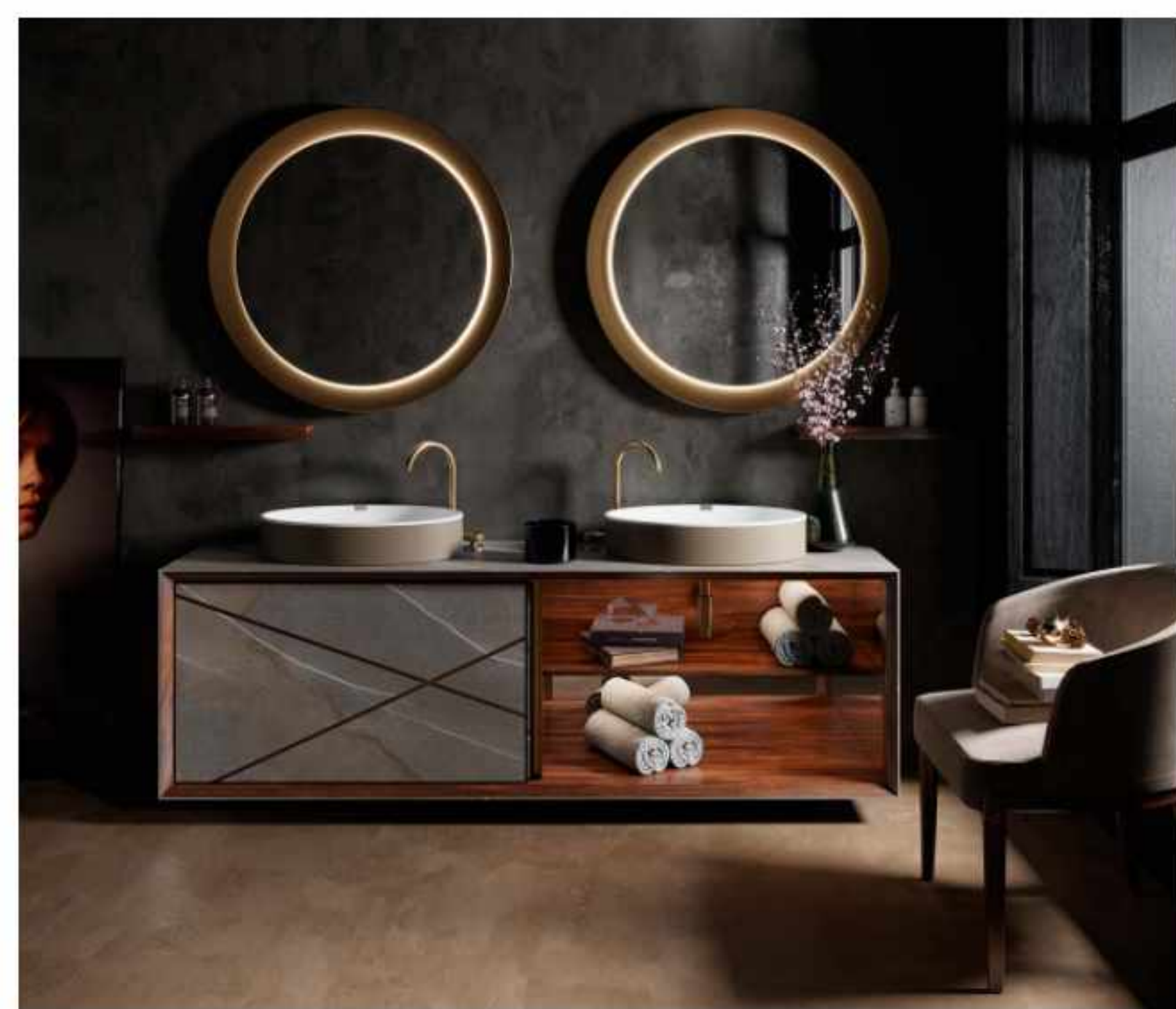
Seventyonepercent, Suite collection

"L'amicizia e la collaborazione tra Paolo Castelli S.p.A. e Iris Ceramica Group, oltre a mettere in evidenza le reciproche potenzialità tecnico-produttive, evidenzia un altro elemento chiave, intangibile, quello del design, fondamentale per la competitività dei prodotti, sia rispetto all'efficienza nel processo di produzione, che alla risposta del mercato – racconta Paolo Castelli – Il buon design diventa quindi il fattore che facilita la traduzione di questo potenziale in forme utili al mercato e in grado di anticipare nuovi codici stilistici".