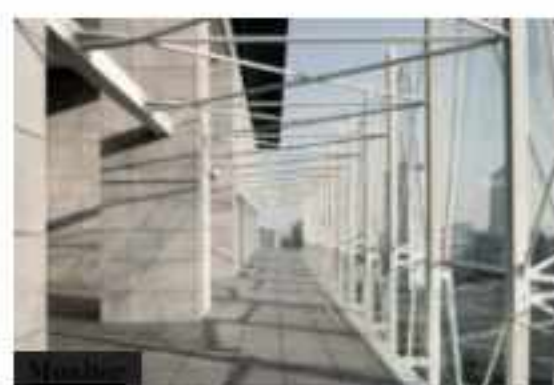
La vocazione green di Fandre Architectural Surfaces