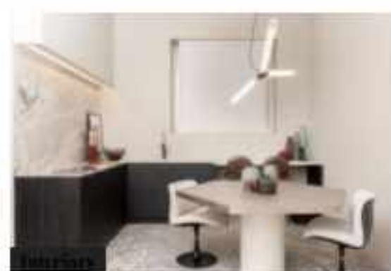
Una casa British per Florim