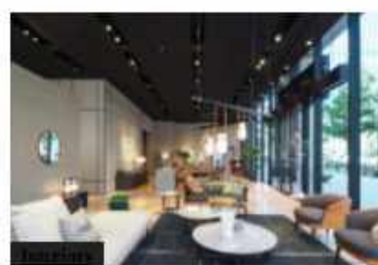
Polltrona Frau guarda a Oriente