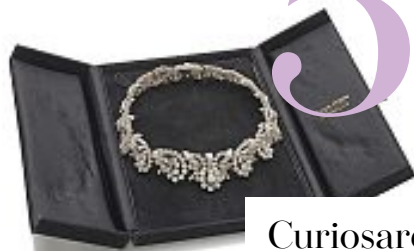
Collana in platino con diamanti, in asta da Faraone Casa d'Aste.

Il museo e giardino botanico comasco di Villa Carlotta non ha ancora riaperto, ma su villacarlotta.it fino a metà gennaio tanti sono gli incontri disponibili in streaming: racconti, disegni e approfondimenti storici.