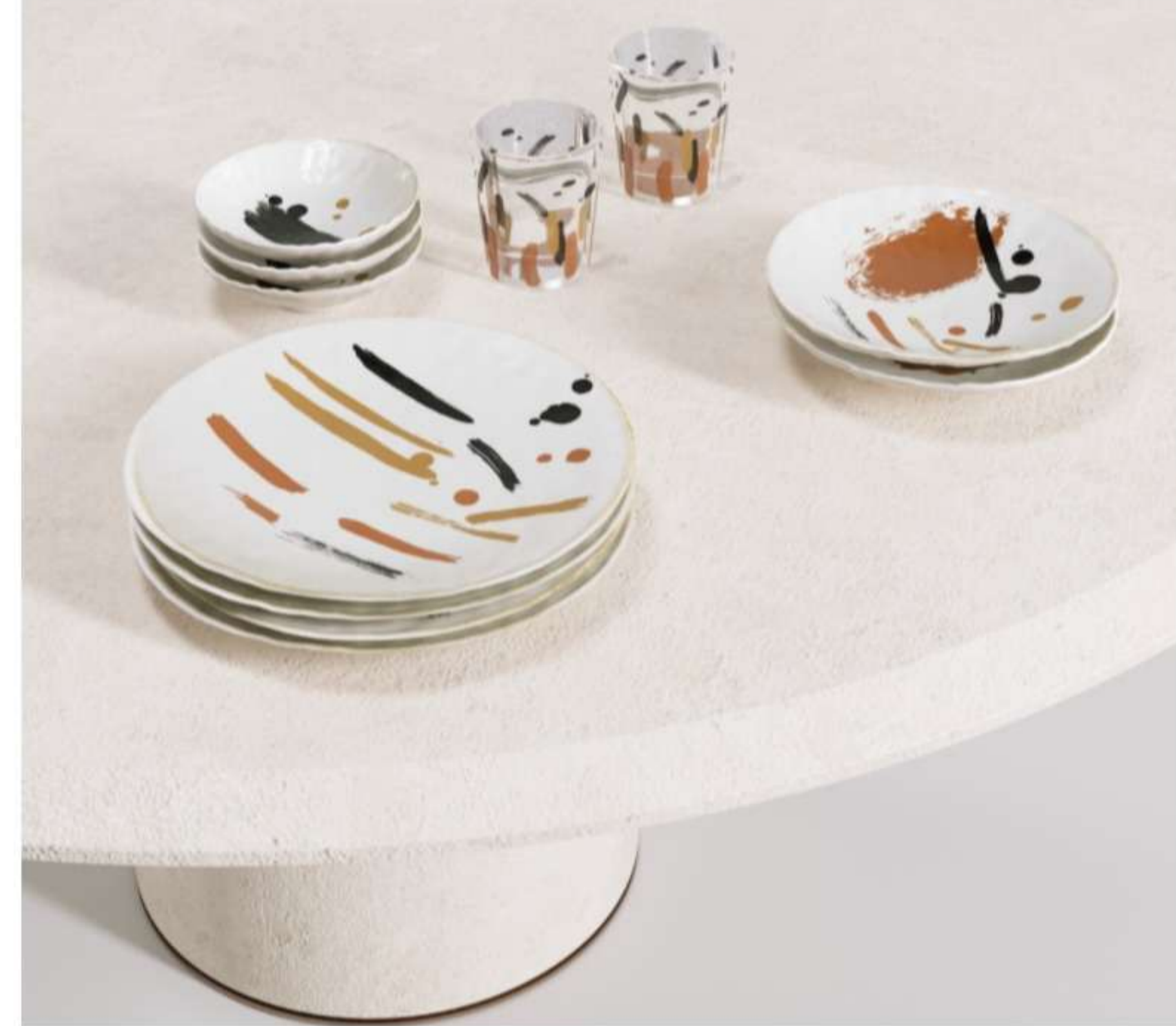
Oggetti d'autore: Omaggio a Morandi