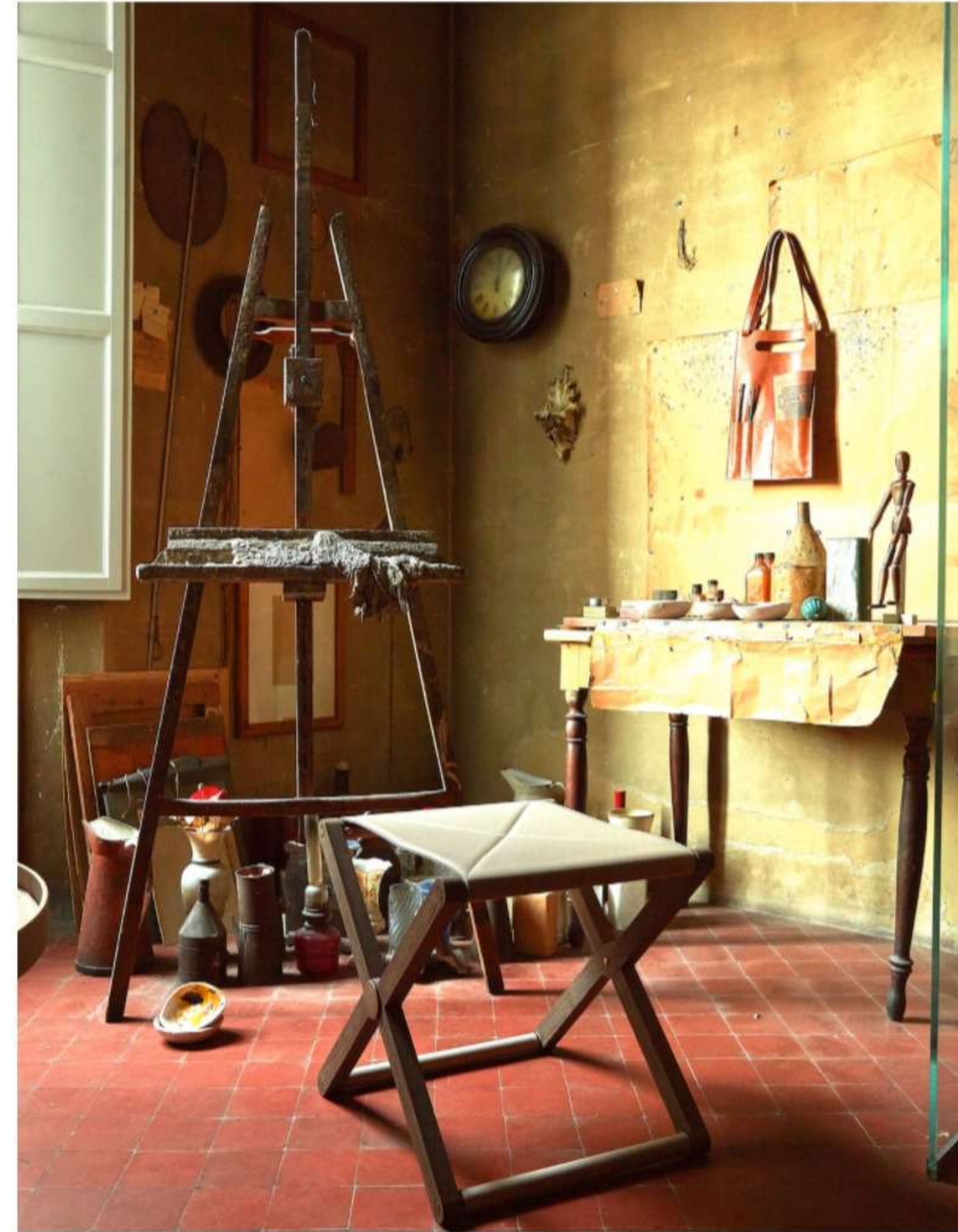
Oggetti d'autore: Omaggio a Morandi fotografati a Casa Morandi

Il risultato è una linea che appartiene tanto al mondo dell'arte che a quello del design, come Strapuntino , il bastone con seduta pieghevole, l' Appendiabito , che sembra integrare un cavalletto per pittura, i vasi in vetro di Murano , la Sacca del pittore portatablet, i piatti dipinti a mano che simulano la tavolozza del maestro, fino alla carta da parati che riprende le pennellate di prova dell'artista.