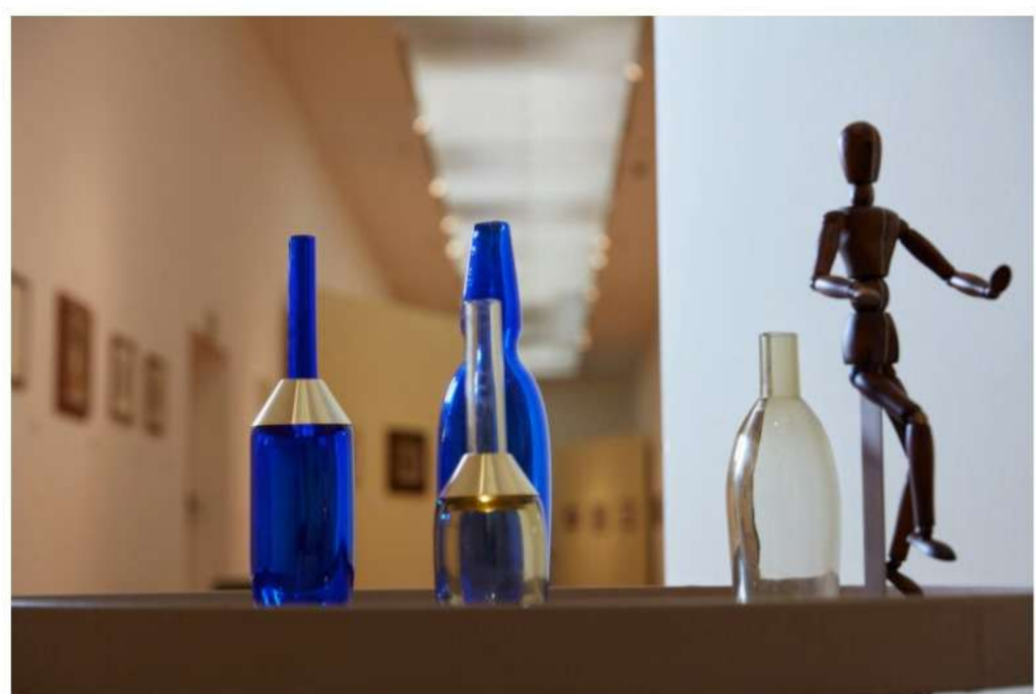
Oggetti d'autore: Omaggio a Morandi

L'arte incontra il design nella nuova collezione di Paolo Castelli ideata per l'istituzione Bologna Musei . Una capsule collection chiamata Oggetti d'autore: Omaggio a Morandi , accessori e complementi d'arredo che reinterpretano la poetica di Giorgio Morandi , uno dei grandi protagonisti della pittura italiana del Novecento.