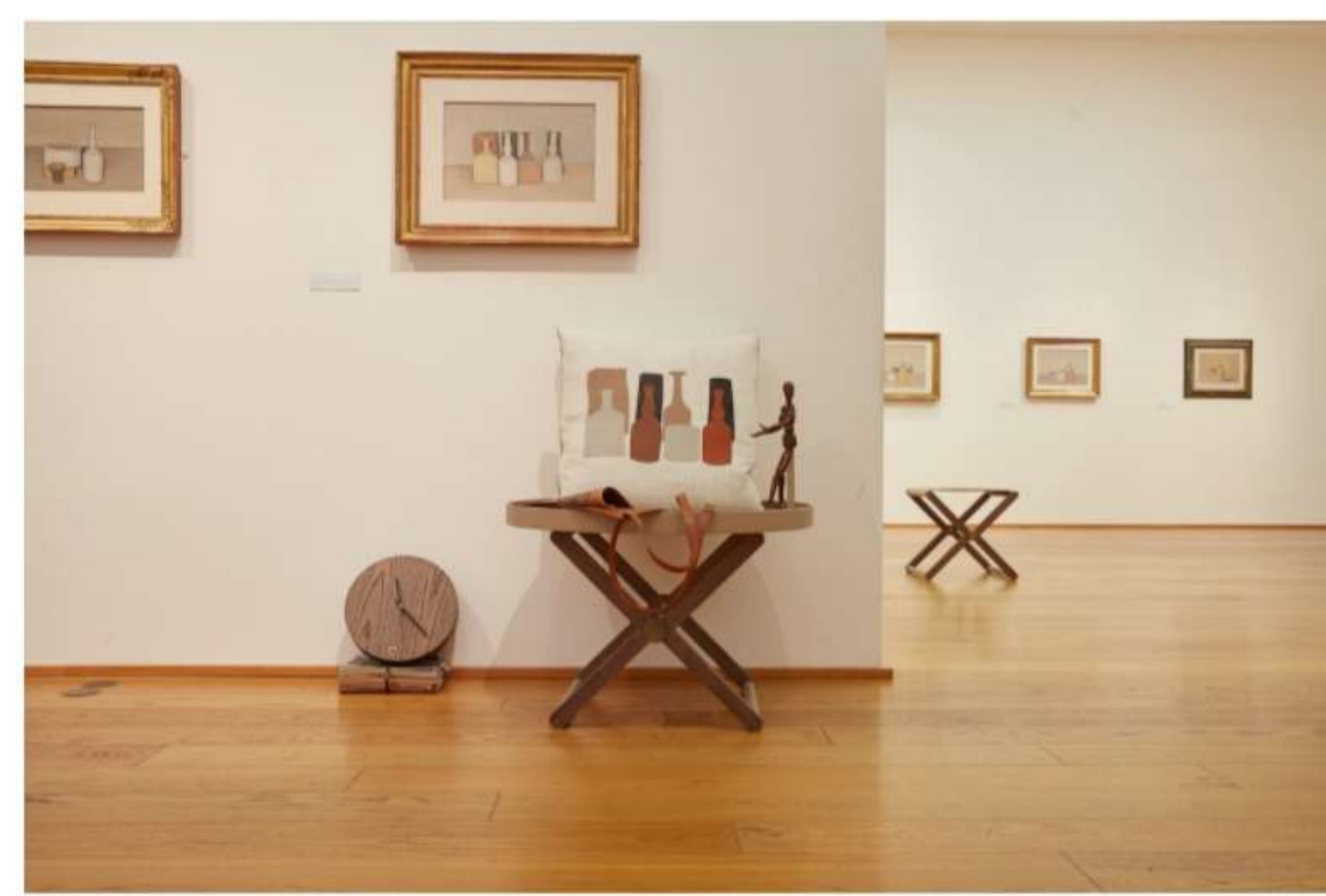
Oggetti d'autore: Omaggio a Morandi, fotografati al Museo di arte moderna di Bologna

L'arte incontra il design nella nuova collezione di Paolo Castelli ideata per l'istituzione Bologna Musei . Una capsule collection chiamata Oggetti d'autore: Omaggio a Morandi , accessori e complementi d'arredo che reinterpretano la poetica di Giorgio Morandi , uno dei grandi protagonisti della pittura italiana del Novecento.