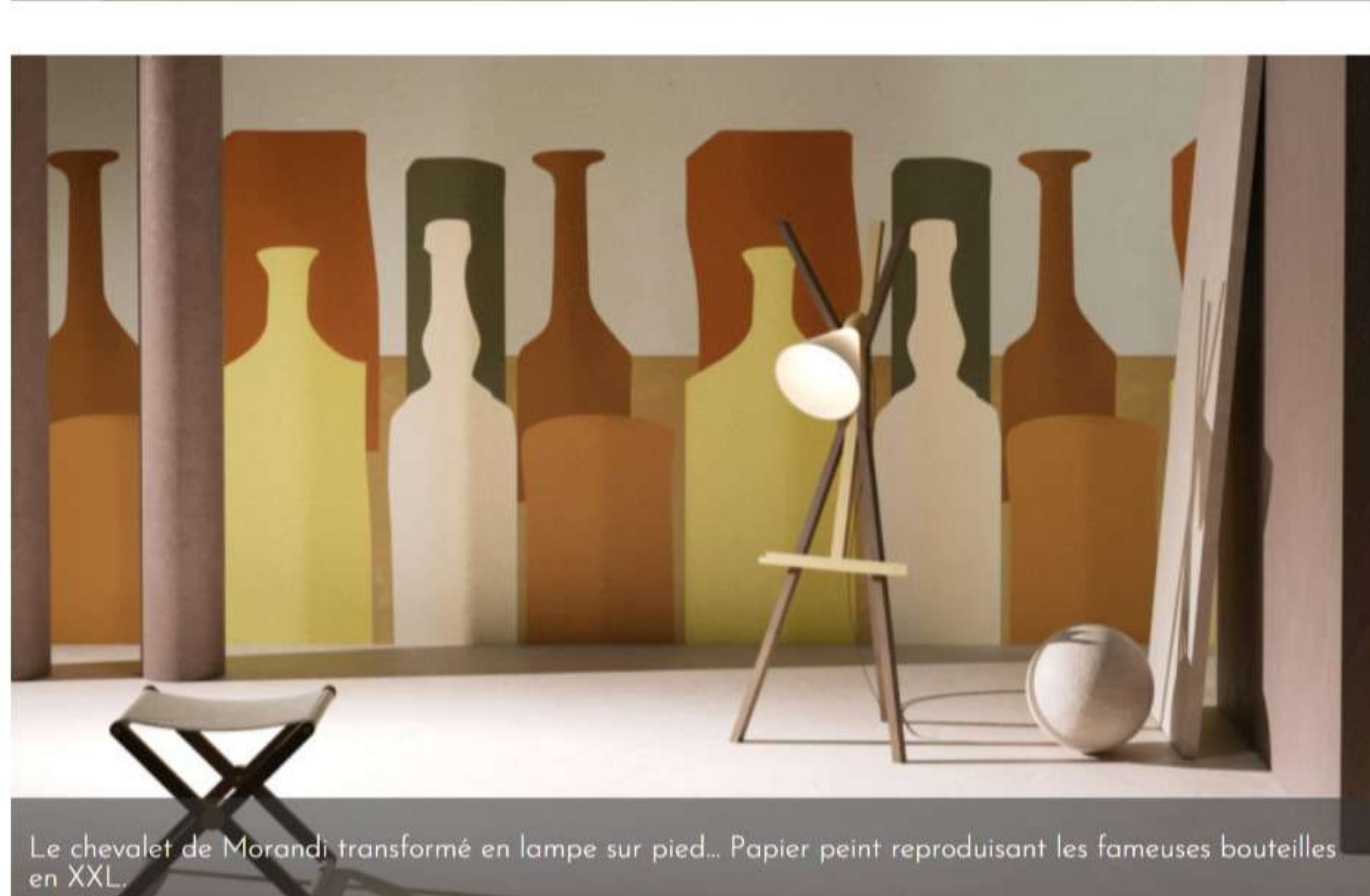
Le chevalet de Morandi transformé en lampe sur pied... Papier peint reproduisant les fameuses bouteilles en XXL.