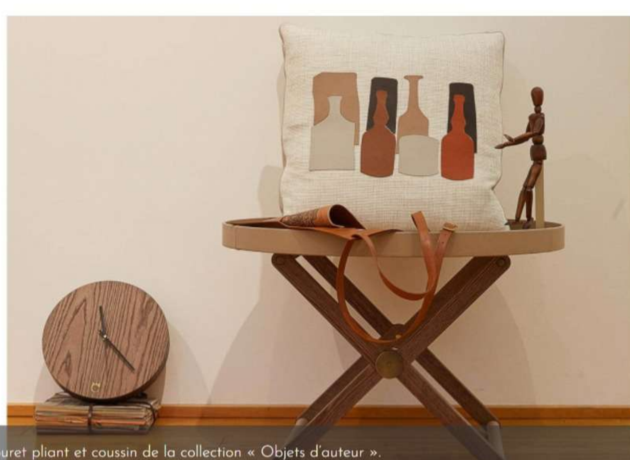
Tabouret pliant et coussin de la collection « Objets d'auteur ».

> Site de la collection « Objets d'auteur » de Paolo Castelli.