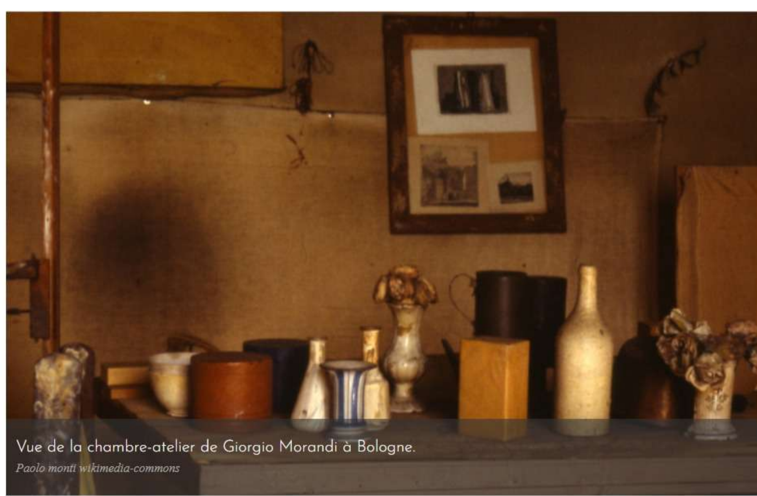
Vue de la chambre-atelier de Giorgio Morandi à Bologne. #filmedia.commont

Il y vivra en effet seul de 1910 à son décès en 1964, ne quittant Bologne que pour un court séjour en Suisse. Peintre immobile, Morandi a essentiellement peint des natures mortes, où l'on retrouve fatalement toujours les mêmes éléments : des bouteilles et des objets en céramique. Une exploration intime de son quotidien qui exerce aujourd'hui une fascination particulière sur les designers, architectes d'intérieur et autres amateurs de décoration. Le musée de Grenoble consacre d'ailleurs actuellement une vaste rétrospective à cette figure majeure de l'art contemporain italien.