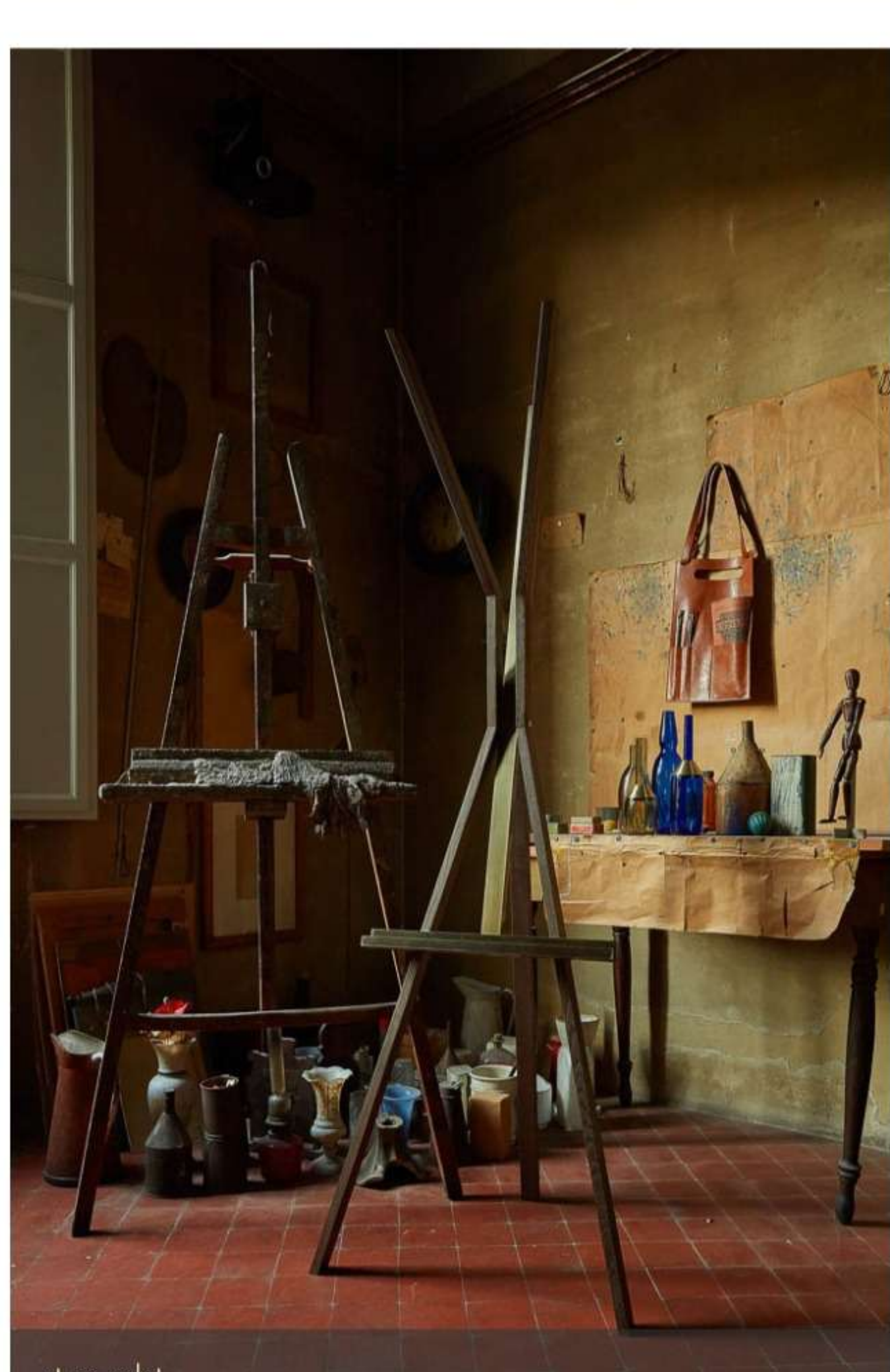
...et en valet.