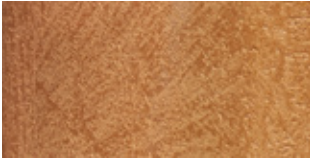
SPECIAL MATERIALS Reconstituted Travertine Col. Earth