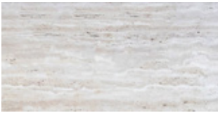
STONE Classic Travertine

I colori stampati sono da considerarsi puramente indicativi.