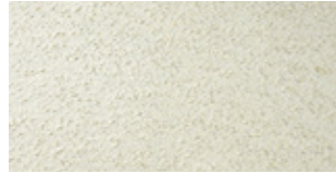
SPECIAL MATERIALS Reconstituted Travertine Col. Ivory