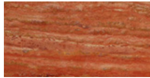
STONE Travertine Col. Red

Printed colors are to be considered as purely indicative.